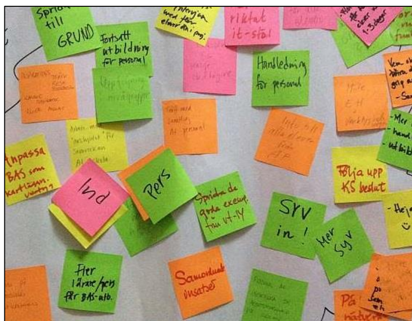
Förslag på aktiviteter för framtiden